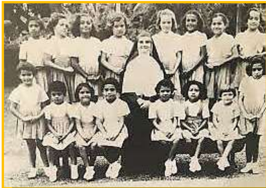
École du couvent mariste, Levuka, anciennes élèves

Les sœurs enseignaient la couture, la broderie et le tricot. Les élèves ne venaient pas seulement des Fidji, il y avait aussi des pensionnaires des Samoa, des Tonga et des Kiribati.