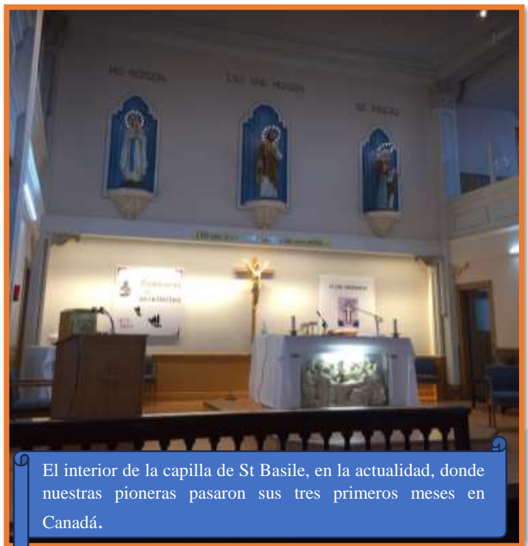
El interior de la capilla de St Basile, en la actualidad, donde nuestras pioneras pasaron sus tres primeros meses en Canadá.